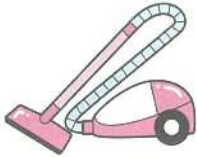
コード式(有線)掃除機