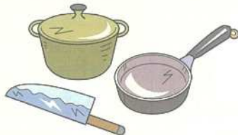
フライパン・鍋・包丁