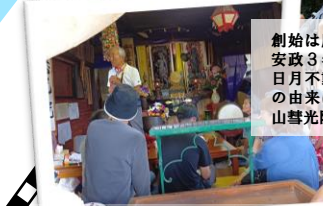
社殿内部も拝見させていただきました！

創始は慶長19年に建立され、社殿は安政3年に再建されたものである。三日月不動尊は全国的にも珍しく、名前の由来は諸説ある。(参考文献：成就山誓光院 三日月不動堂)