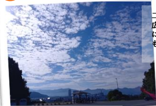
見晴らしが良いスポットです

二の丸があったと言われる広場。広場から東を臨んだ際の塀が目線より下部に造られていることから、景観を意識したものであることが分かる。