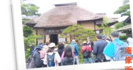
庵の正面には沢庵禅師のご尊像が。原因と像の作者も大御所が手掛けている。

朝廷と幕府の間で起こった「紫衣事件」により、幕府の逆鱗にふれた大徳寺の僧沢庵が上山藩に配流となった。上山藩主土岐頼行は、松山の地に庵を建てて住まわせ、沢庵はここを春雨庵と名づけ3年間過ごした。