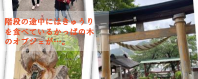
階段を登りきると閑静な林の中から聞こえる鳥のさえずりと素晴らしい景色が迎えてくれます。