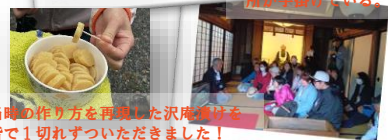
当時の作り方を再現した沢庵揚げを皆で1切れずついただきました！口々に白米が欲しい…との声が上がりました。