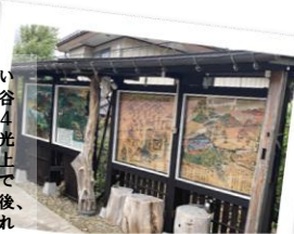
たしかにここからの上山城は丸えてました！

上山藩主が執務及び暮らしていた地。歴史家・画家である萬谷栄三先生が生前描かれた作品4点が納められている。元々は西光寺が建っていたが、ここから上山城が丸えて防備上不都合であったため移転を命じられた後、御殿が建てられた経緯も記されている。