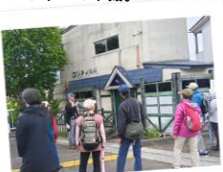
主人公大吾の実家として撮影された可愛らしい洋館。