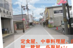
定食屋、中華料理屋、自転車屋、お団子屋、靴屋、呉服屋etc.