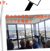
駅の自由通路より開発中の駅東エリアを確認！