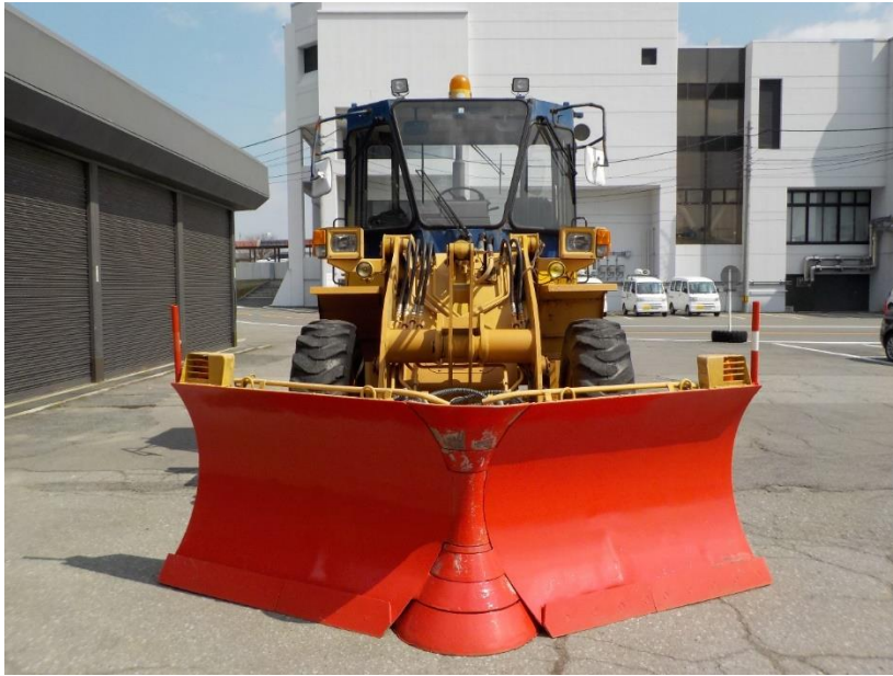
大型特殊自動車 (タイヤトレーサ WA100-1) 正面