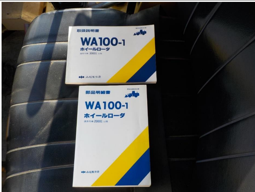
取扱説明書・部品明細書