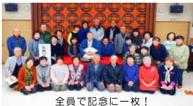
全員で記念に一枚！