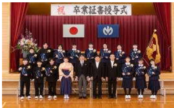
本庄地区卒業生12名（宮川中4名・宮川小8名）