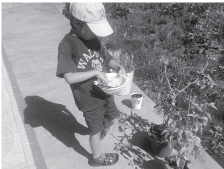
子どもの探究的に学ぶ姿勢の育成を

子どもたちの学びの機会を地域の力で支え、経済状況や居住地域によらず基礎学力の定着と進路選択の幅を広げ、また、社会人講話の時間を設けることでキャリア教育の一助になり得るものと考えます。一方で、安定的に学習支援員等の人材確保ができるのかなどの課題がありますので、今後他市町村の事例を調査研究しながら、地域未来塾の開設が可能かどうか検証してまいります。