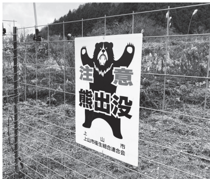
クマ出沒の注意を促す看板

また、政策提言として、クマによる被害を軽減するため捕獲等の対策を強化し、市民の安全・安心の確保