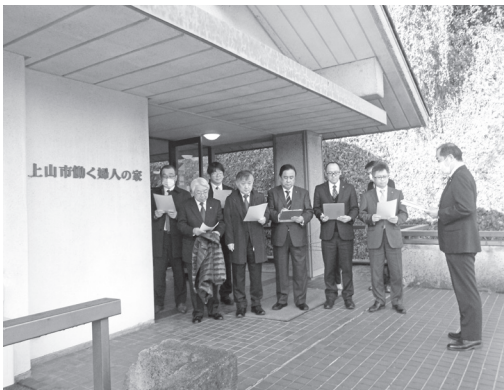
働く婦人の家を調査

そのほか、かみのやま温泉駅前の商業施設等の現地調査と所管する事務の調査を行いました。