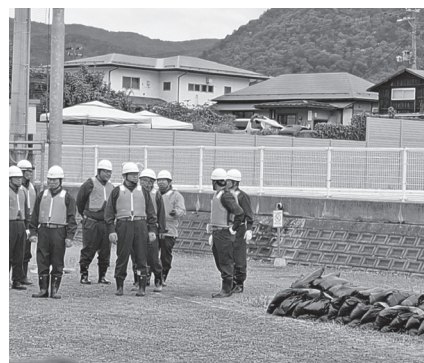
消防団の活動の様子