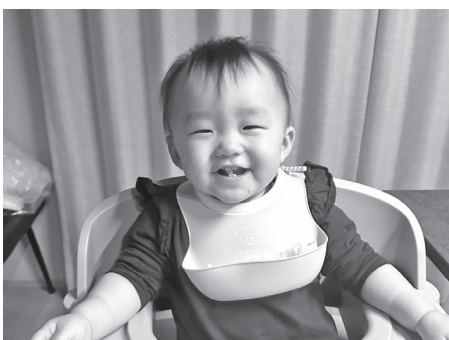
次世代のためにも持続可能な医療体制を

ビジネスホテルの立地は、民間事業者が需給バランスや立地場所を検討し実施するものと考えております。一方で新たな客層の取り込みは必要と考えていますので、関係団体等と調整を図り、機会を捉え民間事業者に対し立地に必要な情報提供を行うなど取組を進めてまいります。