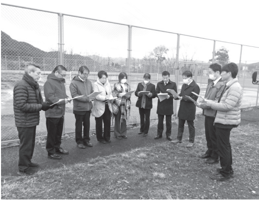
市民多目的運動広場、市民テニスコートを調査

そのほか、中川農業者等トレーニングセンター、南部地区農業者等トレーニングセンター等の現地調査と所管する事務の調査を行いました。