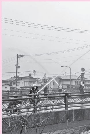
消防出初式での祝賀放水