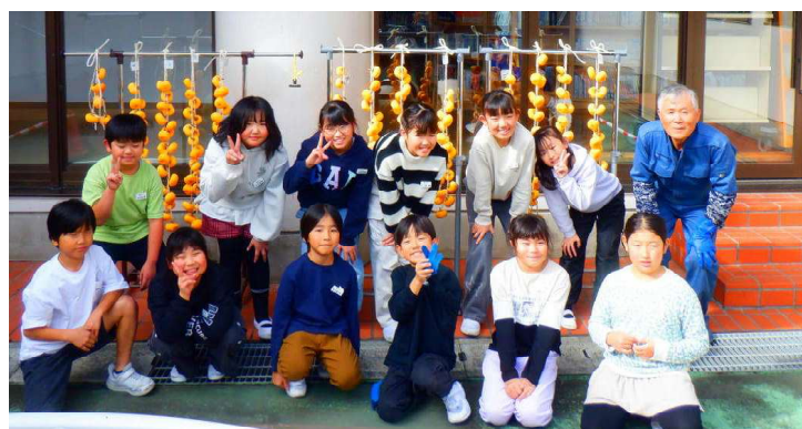
記念にハイポーズ

宮川小学校4年生の授業、総合学習「紅干し柿作り」に公民館がお手伝い。公民館館長の説明を受け、柿の収穫を体験し20個の柿の皮をむきました。思ったより早く皮むきができ、ビックリ。柿縄に柿を吊して「美味しくなれ～」「甘くなれ～」とできあがりを毎日観察しています。今年も美味しい干し柿になりますように！楽しみにしています。