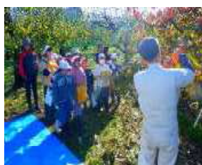
収穫の仕方を説明