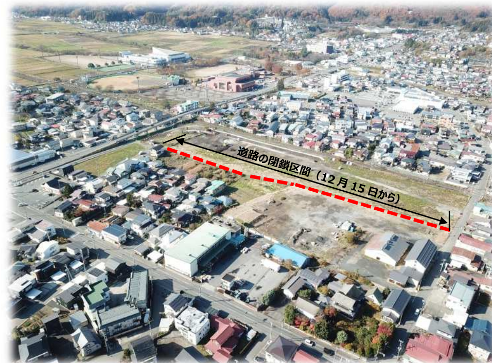
事業地上空からの写真（令和7年11月末撮影）

今年の夏から駅東エリアの整備工事が始まっています。すでに完成した工事もあり、これから始まる工事の準備も進めています。今後、市道矢来四丁目長清水線（敷地内の道路）の閉鎖や、市道矢来金生線（宮ノ脇踏切を通る市道）の通行制限も行う予定です。工事期間中は、皆さまにご不便・ご迷惑をおかけすることになりますが、安全に工事を進めるため、ご理解とご協力をお願いいたします。また、工事に伴う詳しい交通規制などについては、関係する地区の皆さまにあらためてご案内いたします。