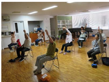
かみかみ・百歳体操