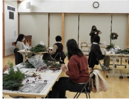
クリスマスリース作り