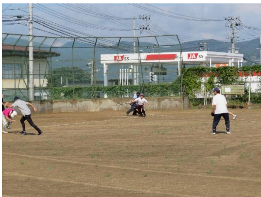
ソフトボール大会