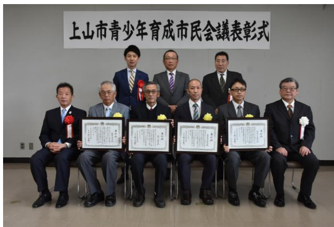
＝青少年育成市民会議表彰式 2団体2個人＝ （青少年の健全育成の推進：青少年育成市民会議による青少年健全育成推進）