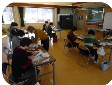
パステルアート教室