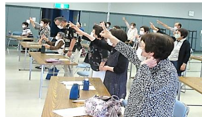
～ともがき～ 「健康講座・ 笑い与健康」