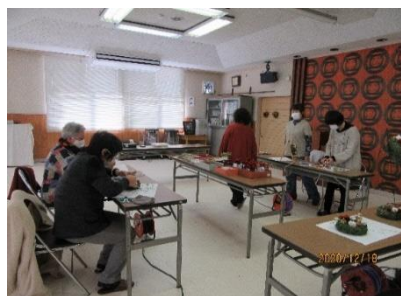
12月 クリスマスリース作り