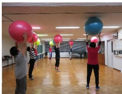
一般講座 バランスボール