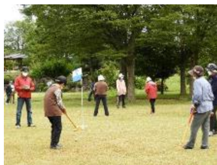
高齢者スポーツ交流会