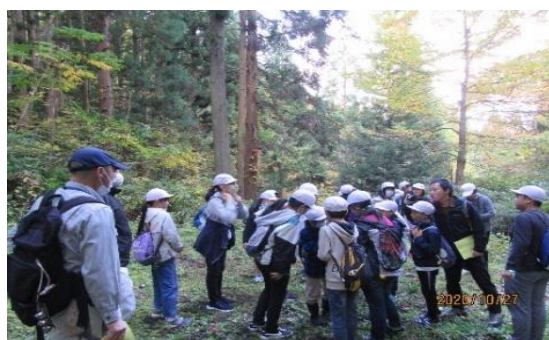
宮川小6年生・金山峠