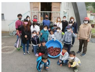
子ども育成事業 さつま芋掘り

新型コロナウイルスの影響により、当地区の大きなイベントである、夏祭り・運動会・そば祭りがことごとく中止せざるを得ない状況の中、各講座事業に於いては令和元年度の講座回数及び延人数を大きく上回る事が出来ました。要因として、兼ねてから計画をしていたピンポン教室（大会）を実施出来た事が大きかった様です。急激な過疎化に伴い、隣人との横の連携が気薄になる中、仲間作りの必要性和重要性を再認識して今後とも取り組んでまいります。