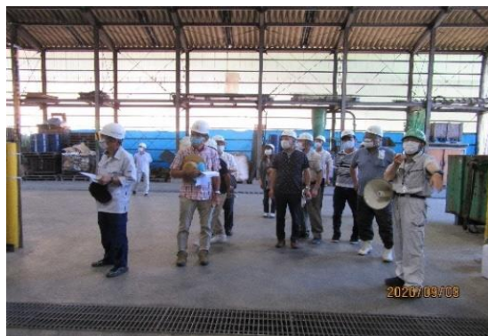
9 月 地区内産業廃棄物処理施設視察 (ふるさとづくり協議会・会長会)