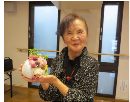
ブッタンアレンジ教室

＜成果＞新型コロナウイルス感染対策のため、一部の事業を延期、または中止としたが、7月以降は、講師の手もとをモニターに映すなど、三密対策を実施しながら事業を行った。手芸教室、七宝焼きなどの素敵な作品は、上山市女性のつどい作品展に出展した。又、コロナ禍でもできる事業の検討のため、10月・2月に事業検討会を実施し、通信事業、屋外事業などのたくさんのご意見をいただいた。