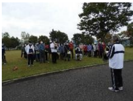
高齢者スポーツ交流会