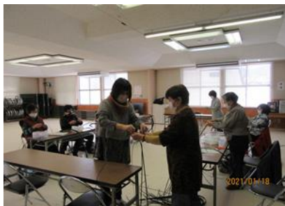
1月 石畳み編みカゴバッグ作り