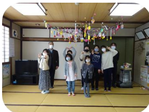
だんごさしの集い