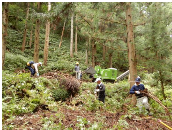
＝金山（国史跡）での市民史跡保全活動＝ （文化財愛護による地域づくり：文化財の適正な保存・管理と利活用の推進）