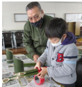
「親子ミニ門松づくり」