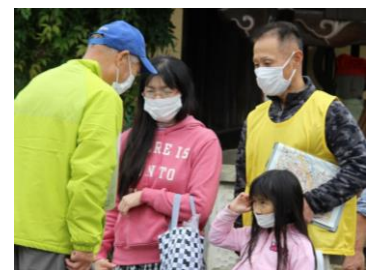
地域の宝探し・ウォークラリー

＜課題＞上山のいいところの再認識のために、地区の名所、坊平などをめぐり、地元の方の知見を活用しながらの事業を展開していきたい。