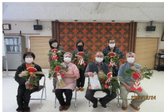
12 月 しめ飾り作り

新型コロナウイルス感染症の拡大を防止するため4月に緊急事態宣言が発動され、当初予定した事業が延期や中止になり、公民館活動や交流が制約される環境ではありましたが、公民館事業に対して多くの地区の皆様や会員の方々に参加していただいたことは意義のある事業として地区に必要とされている証と真摯に受け止め、今後も改善や修正を行いながら事業遂行に努めて参ります。