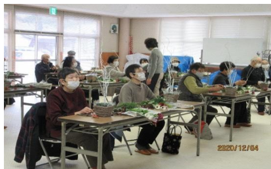
12月 フラワーアレンジメント