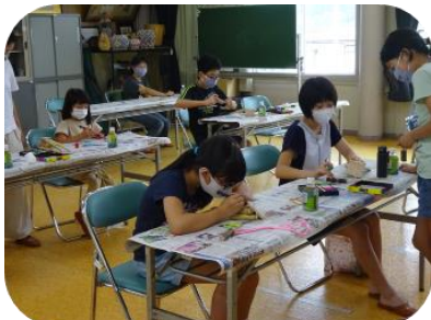
竹のカリオン作り教室