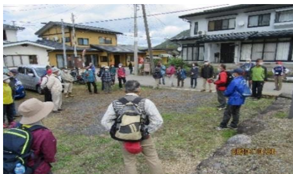
クアオルト②（檜下宿）