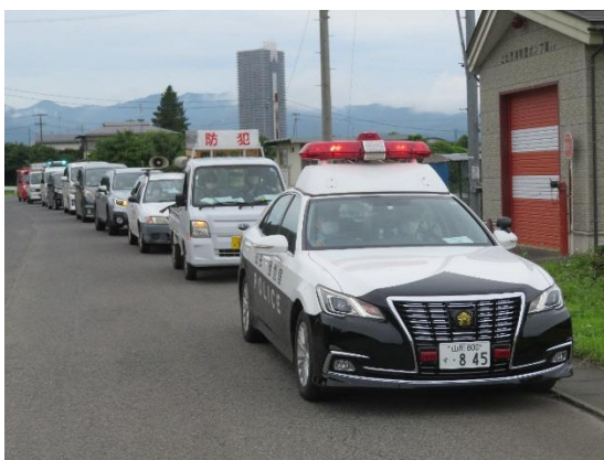
防犯協会中川支部夏の安全パレード