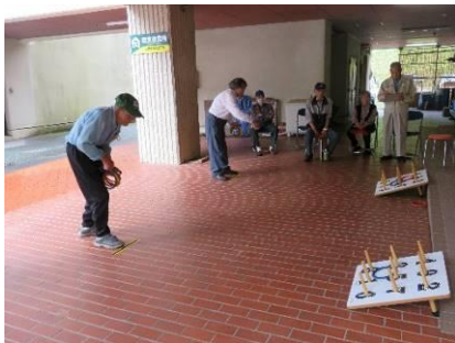
レクリエーション大会

高齢化が急速に進んでいる当地区に於いて、毎年参加人数が減少している現状の中、毎週水曜日にかみかみ・百歳体操を実施出来ている事が大きな活力となっております。今後も新型コロナウイルスの感染防止対策をしっかりと行って取り組んでいきたいと思ひます。