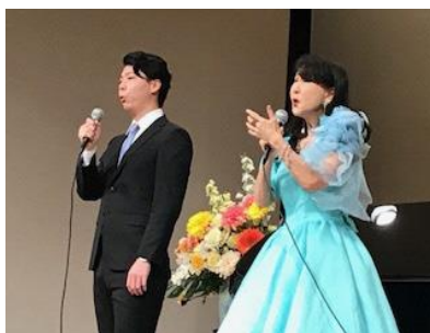
（ 歌声サロンの様子 ）