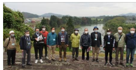
～男性講座～ 「一日研修」