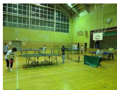
一般講座 ピンポン教室