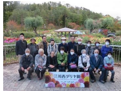
生き活き教室（視察研修）