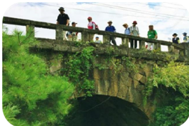
中山橋・二重の石垣で堅牢な「奈可やまはし」