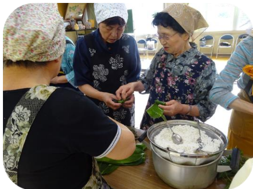
笹巻き・ゆべし作り教室