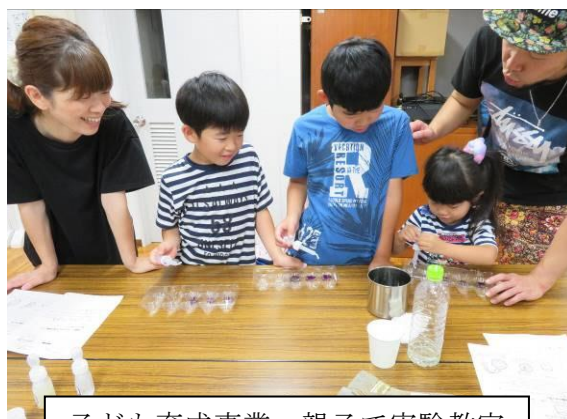
子ども育成事業 親子で実験教室