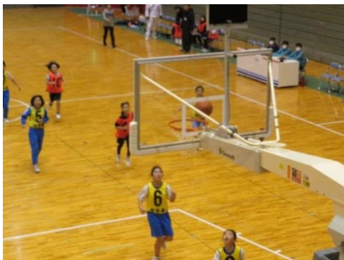
少年少女ミニバスケット大会