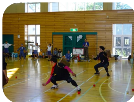
中山地区大運動会