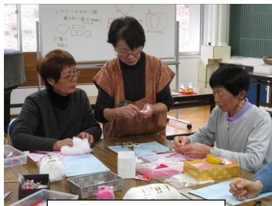
女性講座事業 干支作り