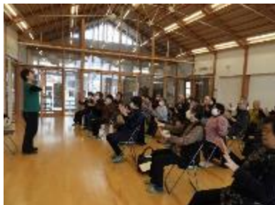
健康体操（日々好日講座）