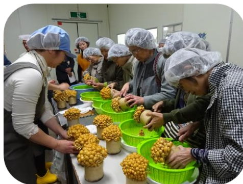
1 日研修（鮭川村方面）