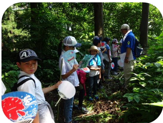
御天守山自然観察会（中山クアの道）

少子高齢社会の今、中山地区は超高齢社会を向かえ、地区民の高齢者教室への参加者は年々増えてきていますが、男性の参加者が増えていない現状です。男性に魅力ある事業を掘り起こして、参加者の増加に繋がる内容を検討、また積極的な呼びかけを行い、楽しんで頂ける様に考えていきます。