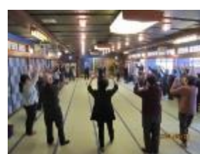
12月 花の寄せ植え教室 2月 健康講話と健康体操教室 2月 温泉で湯ったり・ミュージックケア