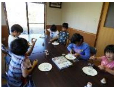
スノードーム作り（石曽根）