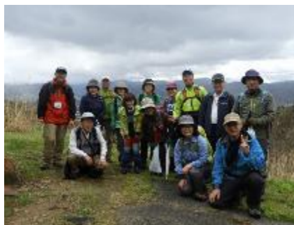
クアの道ウォーキング (石曽根)