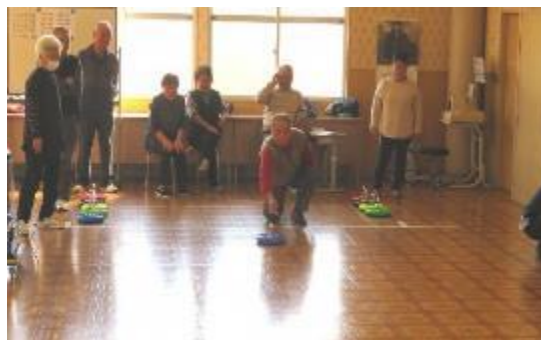
健康講座『カローリング』より