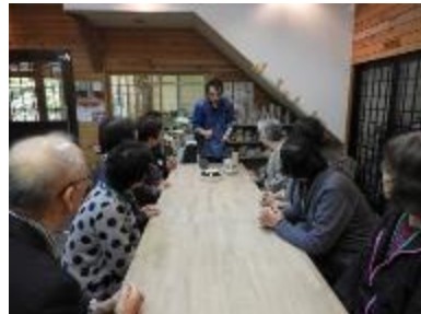
源流の森で陶芸（悠々講座）