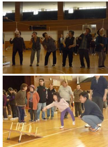
～わきあいあい～ スポーツレク リエーション