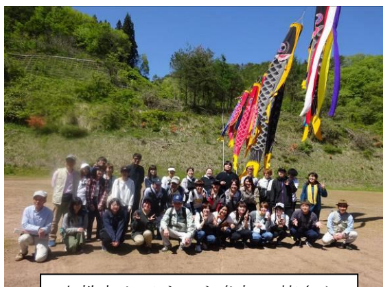
文教大クアオルト参加の皆さん