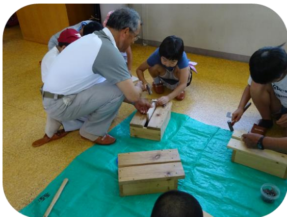
フォトフレーム作り教室

収穫感謝祭は、児童が田植え体験を行って収穫したもち米を使って餅をつき、地域の方々と親子が食育を通して交流を深めた。また、花いっぱい運動ではプランターに植栽した花苗を町内に設置。子供達が日々手入れをし、町内を明るくしてくれた。夏休み講座では、フォトフレーム作りに挑戦した。