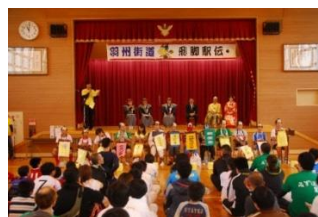
9月 第31回羽州街道飛脚駅伝大会（出発・閉会式）