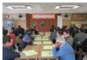
1 月 本庄地区ビジョンを語る会