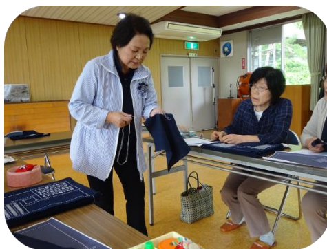
庄内刺し子作り教室