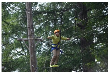
放課後子ども教室