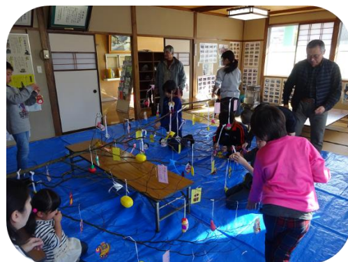
だんごさしの集い