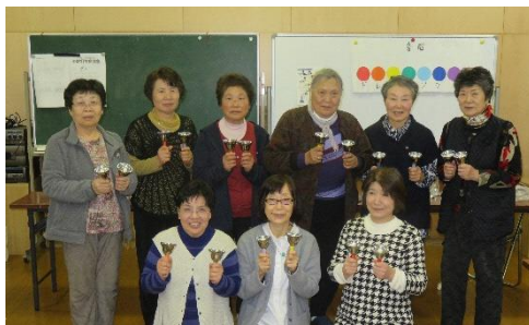
歌とハンドベルの集い