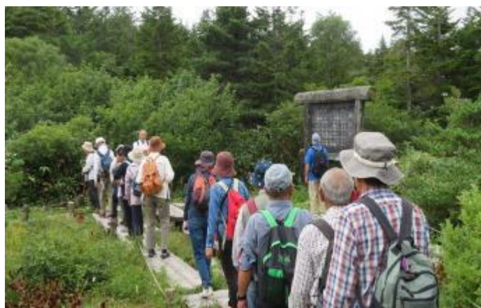
蔵王ハイキングより