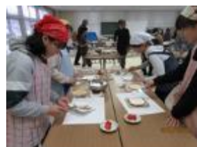
1 2 月 クリスマスケーキ