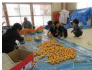
1 1 月 干し柿作り