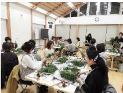
クリスマスリース作り (レディース講座)