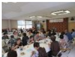
9 月 本庄地区敬老会