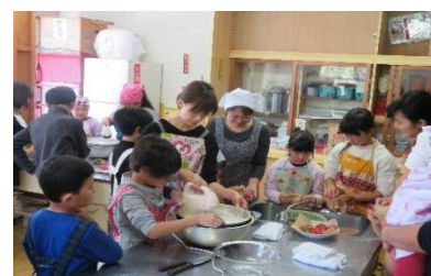
親子ふれあい事業：ケーキづくりより