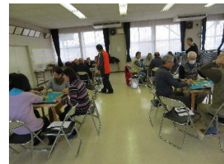
脳トレスポーツマージャン教室