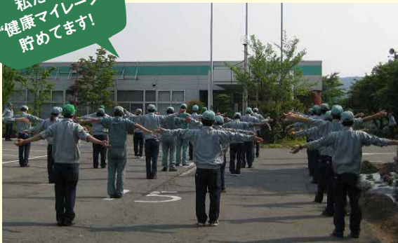
長年、従業員の健康づくりのためラジオ体操に取り組むカネト製作所。その積極的な取組から「健康経営優良法人2018(中小規模法人部門)」の認定を受けた