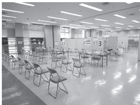
ワクチン接種会場の様子

市長 本市で最初の新型コロナウイルス感染者が確認されて以降、感染症に関連する差別や偏見、誹謗中傷等を行わないように、市報や市公式LINE、ホームページ等で呼びかけを行っているほか、人権擁護委員による啓発活動等が行われております。今後も関係団体と協力しながら、幅広い呼びかけ等を継続してまいります。