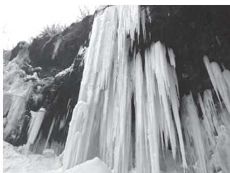
蔵王の仙人沢上流にできる氷瀑(ひょうばく)

市長 ポストコロナ社会において、市内事業者の競争力や時代変化への対応力を確保するため、新規事業展開等の設備投資を支援する必要があります。申請要件の緩和の考えはありませんが、予算の増額は、国、県の経済対策の動向及び市内事業者の設備投資動向を見極め判断してまいります。