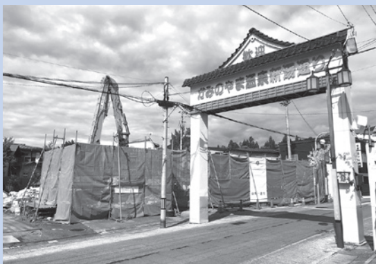
旧映画館解体の様子