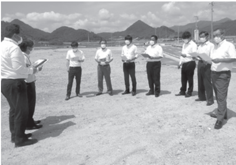
かみのやま温泉インター産業団地を調査

そのほか、市道高松石曾根線排水対策工事等の現地調査と所管する事務の調査を行いました。