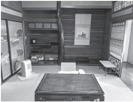
昭和天皇の御座所となった新春の間

教育長 熱中症も心配されることから、状況に応じてのマスクの使用など適切な指導を徹底してまいります。