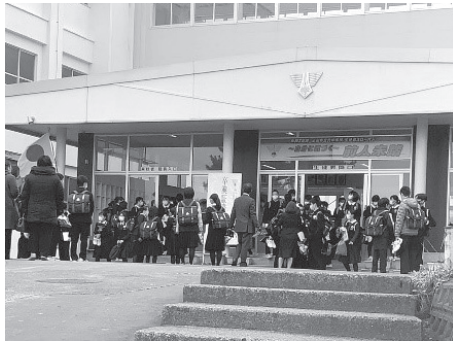
コロナ禍の中学校卒業式後の様子

教育に漫才を取り入れている先進事例によると、温かい雰囲気や連鎖し、いじめや不登校の減少が実証されています。また、コミュニケーション能力、相談する力が育成され、授業中に手を挙げる子どもも増えるなど、学力向上にもつながるということです。教育漫才授業の実施について、教育長のご所見を伺います。