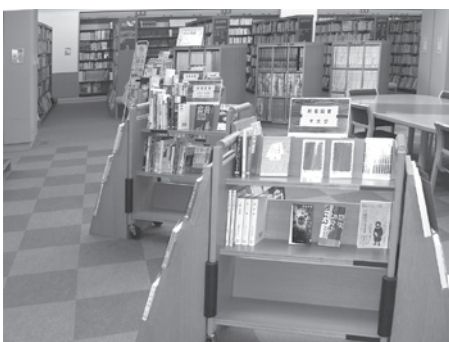
新しい本が毎週増えている市立図書館

教育長 市立図書館の蔵書はホームページで検索が可能です。また子どもたちが市立図書館を訪れることでより多くの図書に触れる機会が増え、読書への関心を高めることが重要と考えられるので図書データの共有による相互貸借を行う考えはありません。