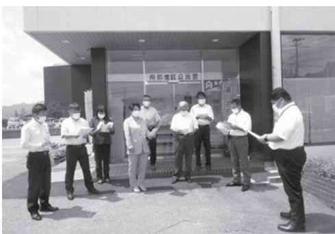
南部地区公民館耐震補強等工事を調査

そのほか、南部地区公民館耐震補強等工事の現地調査と所管する事務の調査を行いました。