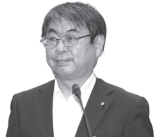
守岡 等 議員

新型コロナウイルスは、とりわけ子どもたちの心身の成長に大きな影響を与えており、統計的にもいじめや不登校、自殺が増えています。今後、いのちを守る相談活動を強化するために、SNS等を活用した相談活動を実施し、子どもたちの不安や悩みに答え、自殺予防対策の強化を図るべきと考えますが、教育長のご所見を伺います。