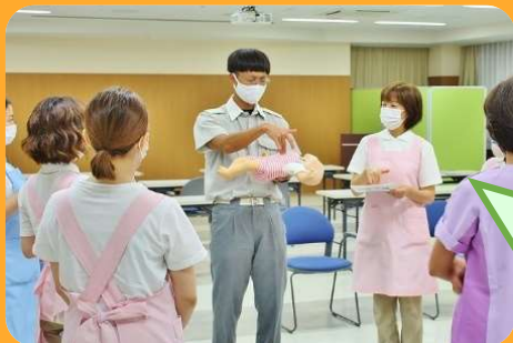
乳児の蘇生法について

消防署の方の指導による講義と演習を行いました。当保育室では、万に備え、救急体制を整えています。