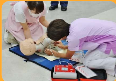
小児の蘇生法について

消防署の方の指導による講義と演習を行いました。当保育室では、万に備え、救急体制を整えています。