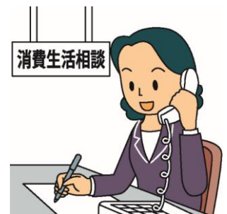
消費者庁イラスト集より

消費生活相談員が、相談事を解決できるように対処方法の助言や情報提供などを行ないます。